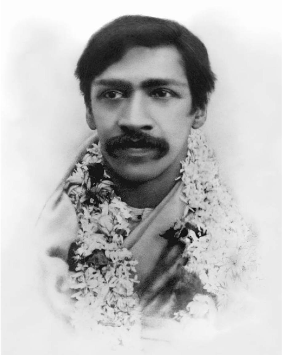
Sri Aurobindo at Amraoti, January 1908